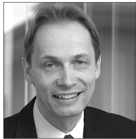
Von Philip Robinson

Seit ihrer Einführung im Jahr 1995 nimmt die Schweizer Mehrwertsteuer in der Rangliste der «administrativen Ärgernisse» der Unternehmen regelmässig einen Spitzenplatz ein, weil einerseits diese Steuer als sehr komplex und schwierig in der Anwendung wahrgenommen wird und weil andererseits unerkannte Fehler in der Handhabung der Mehrwertsteuer ein beträchtliches Risikopotenzial bergen.