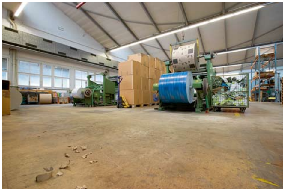
L'étude analyse les facteurs susceptibles d'influencer l'importance des dividendes de faillite et de concordat. À cette fin, treize cas de faillite et de concordat récents ont été étudiés. Les résultats ont ensuite été passés en revue lors d'entretiens avec quatre experts confirmés.