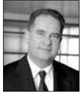
*Partner Ernst & Young, responsable Technology & Security Risk Services (TSRS);

L'enquête indique en outre que les besoins commerciaux et l'abaissement du coût du sans fil amènent à une adoption large et rapide des technologies mobiles. Mais avec des appareils mobiles quittant désormais l'environnement contrôlé de l'entreprise, les données et la propriété intellectuelle qu'ils transportent deviennent la responsabilité des utilisateurs qui doivent les protéger – une responsabilité que beaucoup de