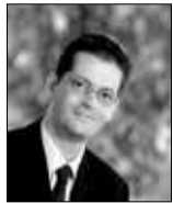
**Ernst & Young, responsable TSRS Suisse romande

sociétés n'ont pas encore pleinement acceptée ou anticipée. Moins de la moitié des sociétés mettent en place des mesures de formation ou d'information des utilisateurs sur l'impact des technologies mobiles sur les problèmes de sécurité, et un nombre encore inférieur fournit une formation pour répondre aux incidents de sécurité.